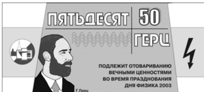
Валюта Дня Физика образца 2003 года

Пошли в профком. Там вдруг говорят, что, мол, скоро "Студенческая весна" и если мы представим полнометражный спектакль, то нам оплатят билеты в Одессу. Нормально. Зотин идет в библиотеку, берет Гельмана, автора таких пьес, как "Цемент", "Парторг" и др. Почитав пять минут, понимает, что таких пьес можно написать сколько хочешь. А между прочим остается 2 дня. А полнометражный