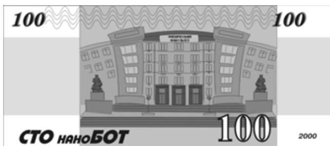
Валюта Дня Физика образца 2000 года