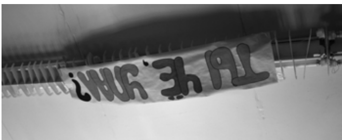
Потолок. Надпись. Минск.

В ДФ никакой крамолы не было, но просто такая обстановка свободы многим не нравилась и под разными предложениями пытались его прекратить. Сначала не разрешали исполнять оперу "Архимед", в которой я на тот момент исполнял партию Аполлона. Затем ДФ запретили под смешным предлогом пожарной безопасности. После того, как моя фамилия случайно оказалась в третьих списках в военкомате, и меня забрали в армию, я был обижен на Физфак. Поэтому долгое время я не посещал ДФы и только последние два года вернулся к Alma матери. За это время многое на ДФ изменилось, народ стал другим. Тогда было больше взаимодействия между преподавателями и студентами, концерты проходили не в ЦФА, а в ДК МГУ, выступления на ступеньках были более масштабными, весь фасад Физфака заклеивался плакатами, транспарантами. Раньше было более сильное ощущение праздника. Тогда в Москве не было народных гуляний. Поэтому народ приходил, чтобы просто поучаствовать в таком мероприятии. Это освещалось в газетах. День Физика и День Химика проводились в одно и тоже время. Собирались толпы у факультетов и пытались перещегоолять "противника". Кстати, крылатое выражение "Мы любим физику и мать ее, философию" появилось именно на ДФ.