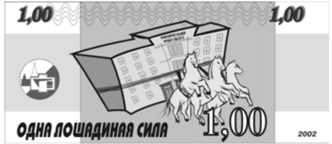
Валюта Дня Физика образца 2002 года